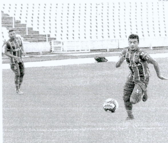
Sampaio Corrê inicia sua jornada na Copa do Nordeste 2019 em busca do bicampeonato

Sampaio Corrê, atual campeão, estreia na Copa do Nordeste 2019 diante do Ceará, nesta quinta-feira