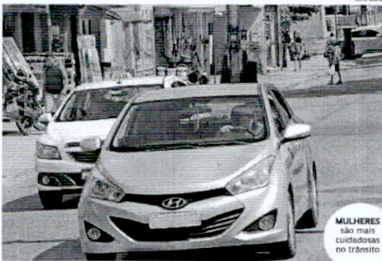
MULHERES são mais cuidadosas no trânsito

Mas não é apenas a presença das mulheres ao volante que apresenta menores índices no trânsito do estado. Segundo uma pesquisa realizada atualmente pela Seguradora Líder, que detém contrato para gestão e pagamento do seguro DPVAT em todo o Brasil, apenas 24% dos acidentes de trânsito registrados no Maranhão tiveram