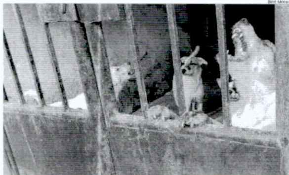
Cães abandonados em uma residência no Bairro de Fátima estavam há mais de 48 horas sem alimentos

MONALISA BENVENUTO Da equipe de O Estado