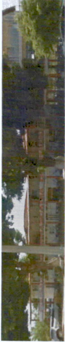
CHURRASCARIA E POUSSADA DOURADO