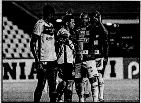
OTRICOLOR MARANHENSE NÃO GANHA FORA DE CASA E AGORA RECEPIONA OS TORCEDORES DENTRO DO CASTELÃO.

Agora, o Sampaio faz uma pausa no Nordeste e se prepara para enfrentar o Moto Club, no próximo domingo, no mesmo local (Castelão), decidindo uma vaga para a final do segundo turno do Campeonato Maranhense. Na Copa do Nordeste, o