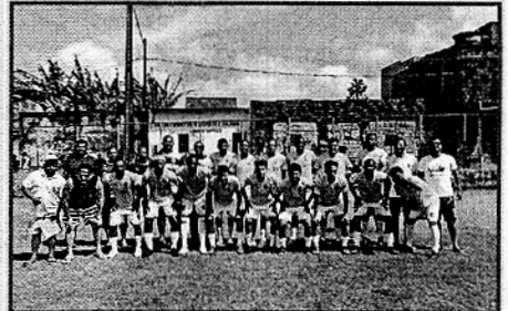
EQUIPE DO LENDAS

LENDAS VENCE O GUARANI E CONQUISTA O PRIMEIRO TURNO DO CAMPEONATO DO SANTO ANTÔNIO